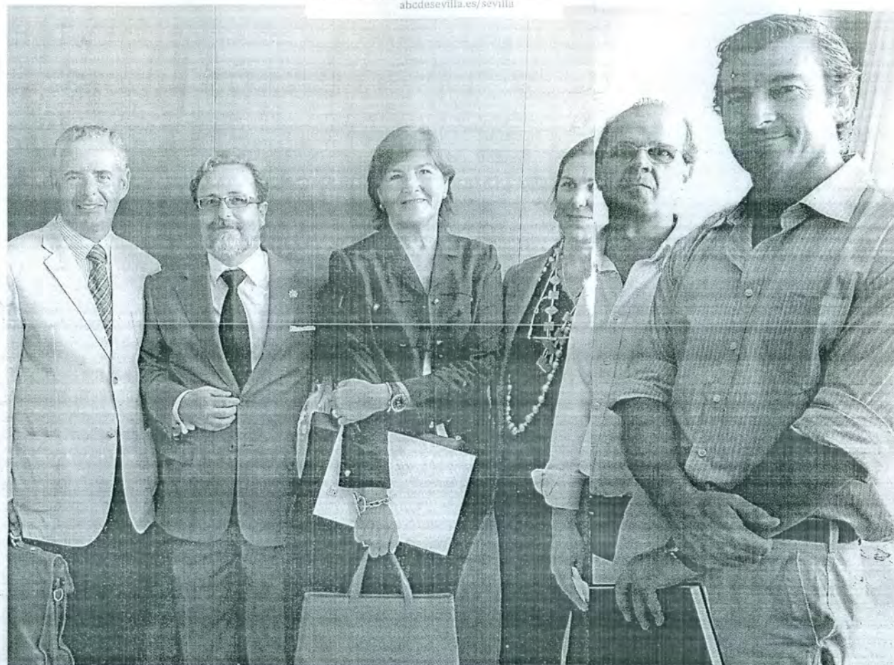
Asistentes al acto de ayer firmando el manifiesto