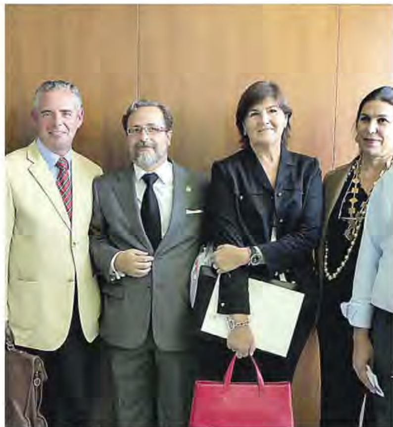
Asistentes al acto de ayer firmando el manifiesto

La acusación también planteó nulidad del auto de la Audiencia Provincial que consideró en junio ajustada a derecho la actuación del juez. En aquella ocasión su iniciativa fue apoyada por la fiscalía.