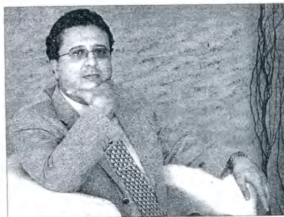
QUEJA. Una federación de mujeres solicitó que se le investigara.