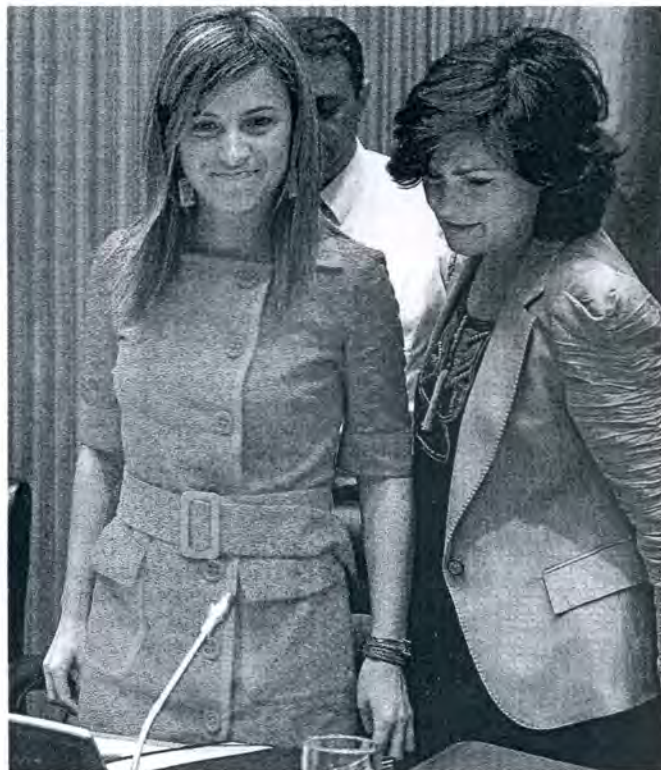
La ministra Bibiana Aído junto a la presidenta de la Comisión de Igualdad del Congreso, Carmen Calvo.

Al concluir su presentación, Aído tuvo que contener algunas sonrisas nerviosas ante las duras críticas a su gestión que le dirigieron los portavoces del PP y PNV. «Quizá quería pasar desapercibida», comenzó dicién-