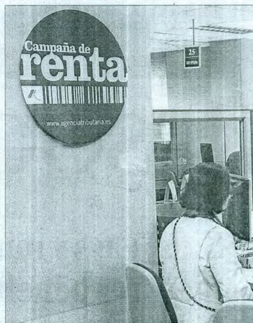
Una ciudadana realiza la Declaración de la Renta en una oficina

La Federación Estatal de Lesbianas, Gays, Transsexuales y Bisexuales, la