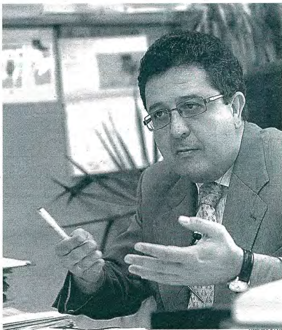
El máximo órgano de los jueces también archivó la queja